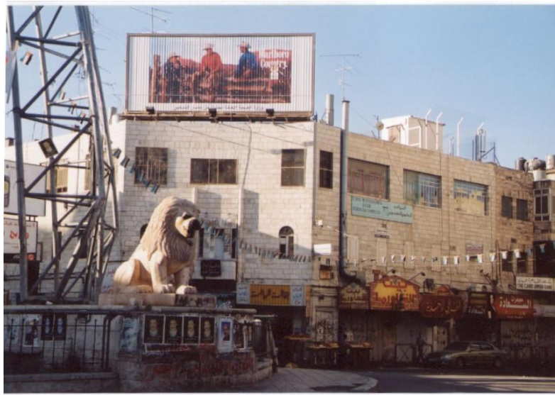
Per le vie di Ramallah, alle 7 di mattina