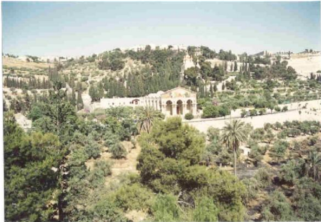
Gerusalemme, Il monte degli Ulivi La Chiesa di tutte le Nazioni, con il Getsemani