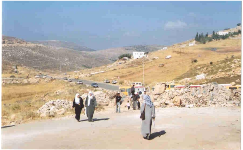
Verso Ain Arik. Strade bloccate. Ovvero: scene di quotidiana umiliazione.