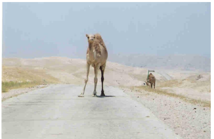
Nel deserto di Giuda