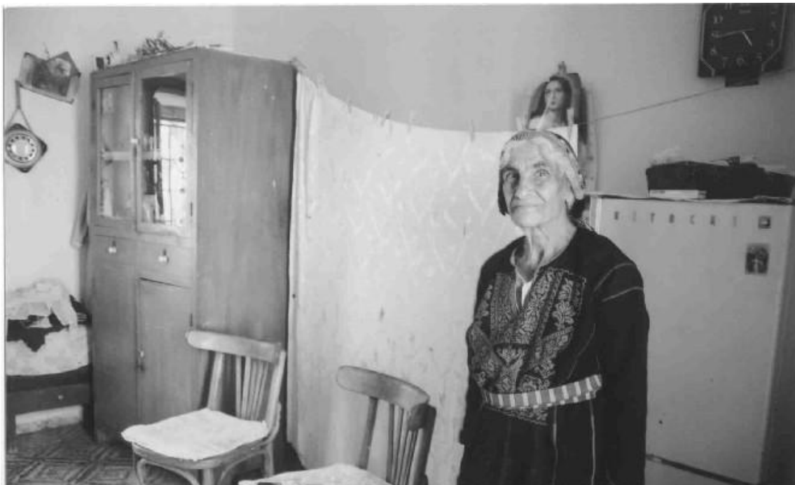
Un'amica del villaggio di Ain Arik (...semplicità e saggezza)