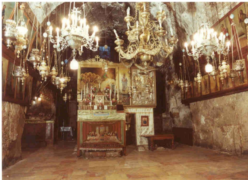
Gerusalemme, Monte degli Ulivi. La grotta - chiesa ortodossa che custodisce il sepolcro di Maria. (foto acquistata sul posto).