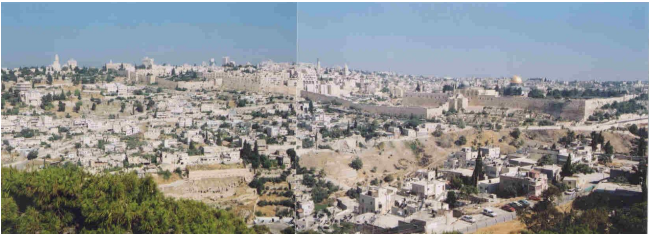
La collina della Città Vecchia, con la cinta muraria e la bellissima cupola d'oro della moschea, vista dal Monte degli Ulivi.