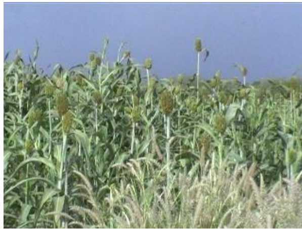
spighe di sorgo