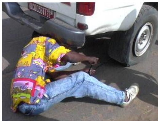
Nuvole minacciose mentre cambiamo la ruota...