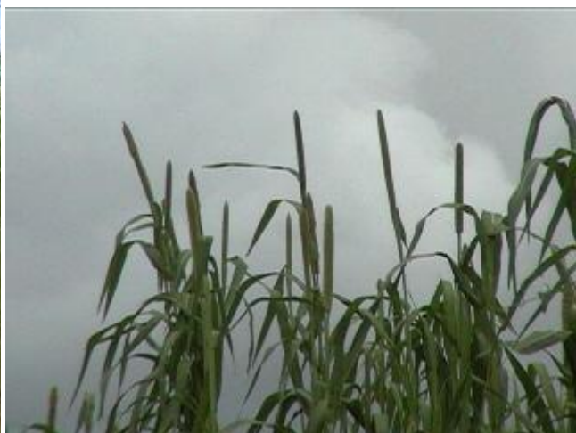
Spighe di miglio

Dopo N'Djamena, la prima città che si incontra è quella di Bongor. Normalmente ci si arriva dopo tre ore di auto. Ma questa volta... foriamo una gomma! E così ci arriviamo un bel po' dopo.