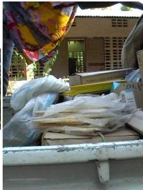
I libri e il materiale didattico da scaricare.